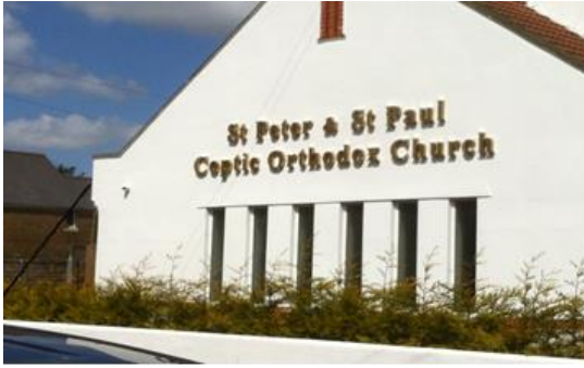
الصليب في اعلى مبنى الكنيسة يافطة عليها اسم الكنيسة