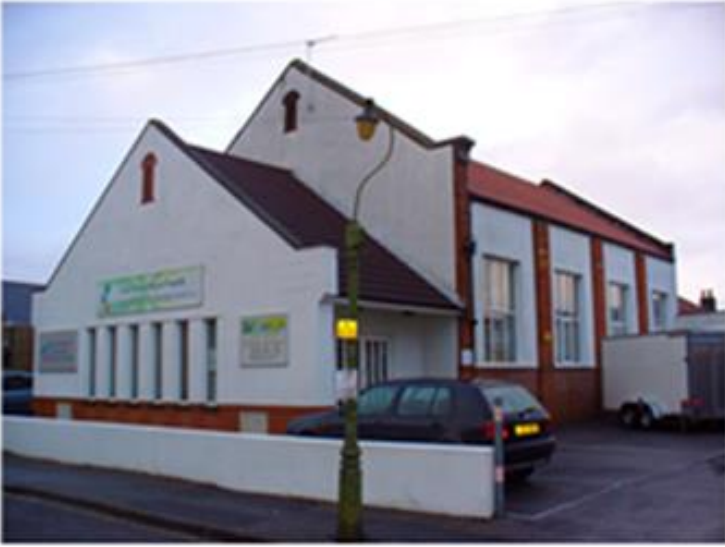
مبنى الكنيسة التي تم شراؤها