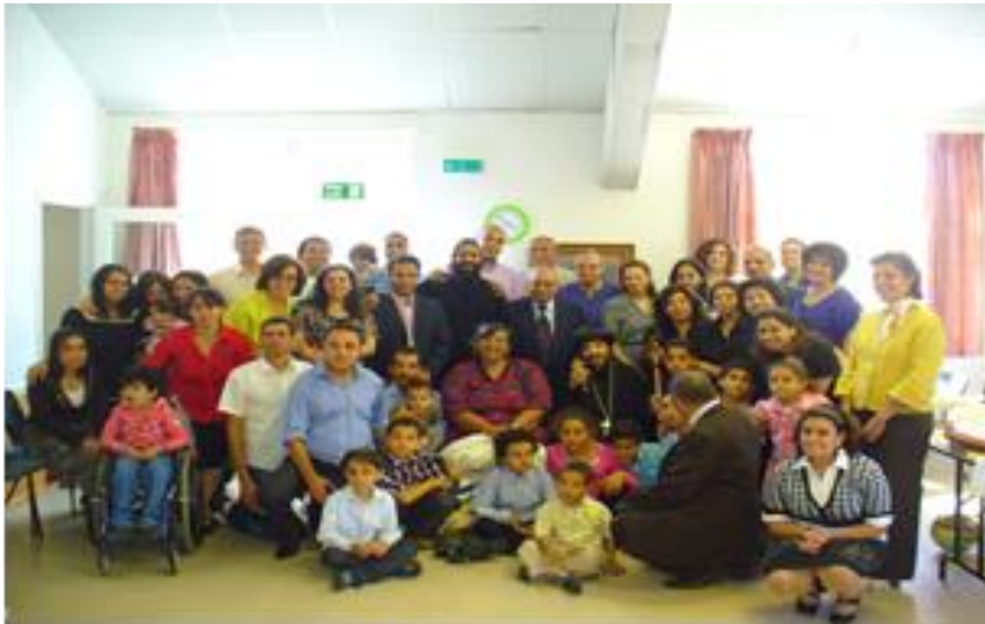
نيافة الأنبا أنتوني مع شعب الكنيسة في يوم الأفتتاح