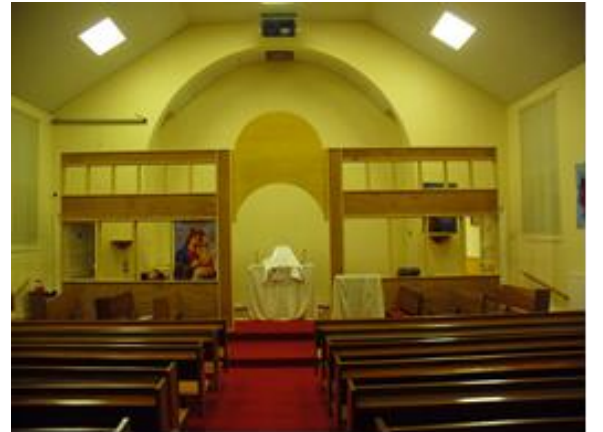
الأيقونات قبل وبعد وضع الأيقونات